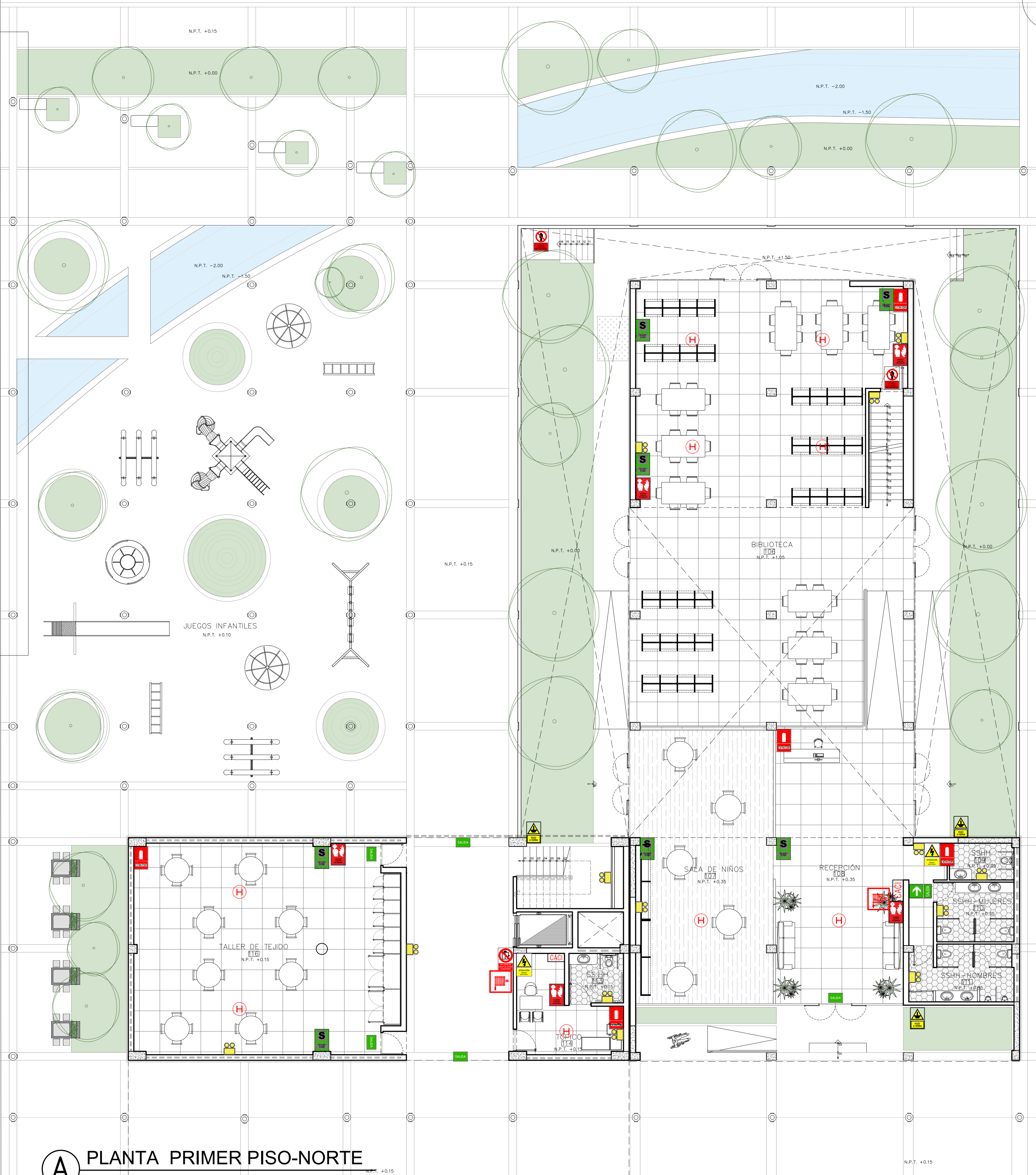
A PLANTA PRIMER PISO-NORTE ESCALA 1/100